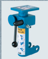
لوحة محول 4 40 ملم عدة التحويل